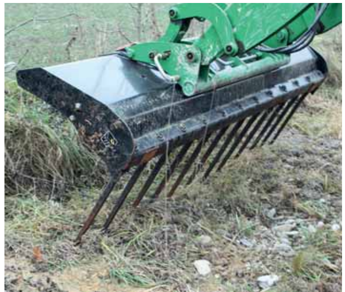
Sabine Wiencirz (2)